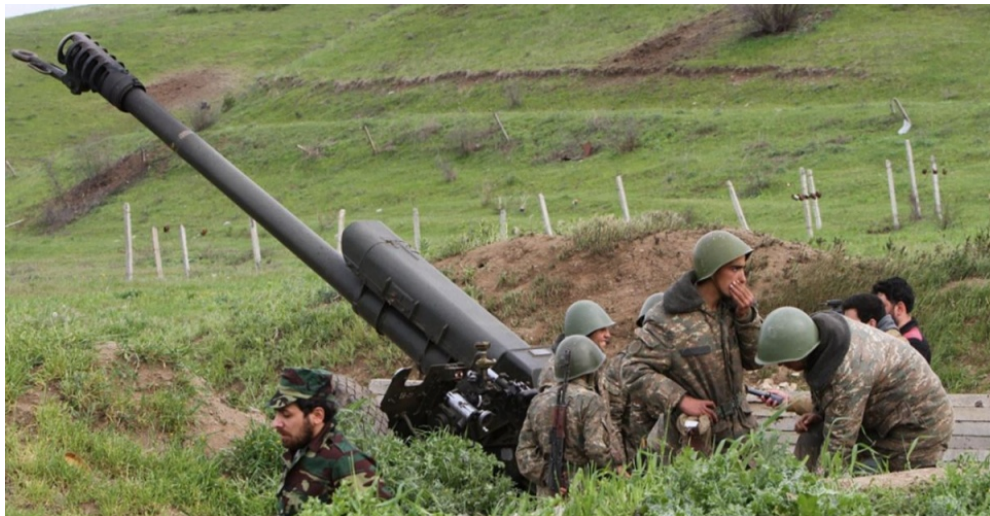
"Қарабақ - қайта оралған бақыт!" (Видео)