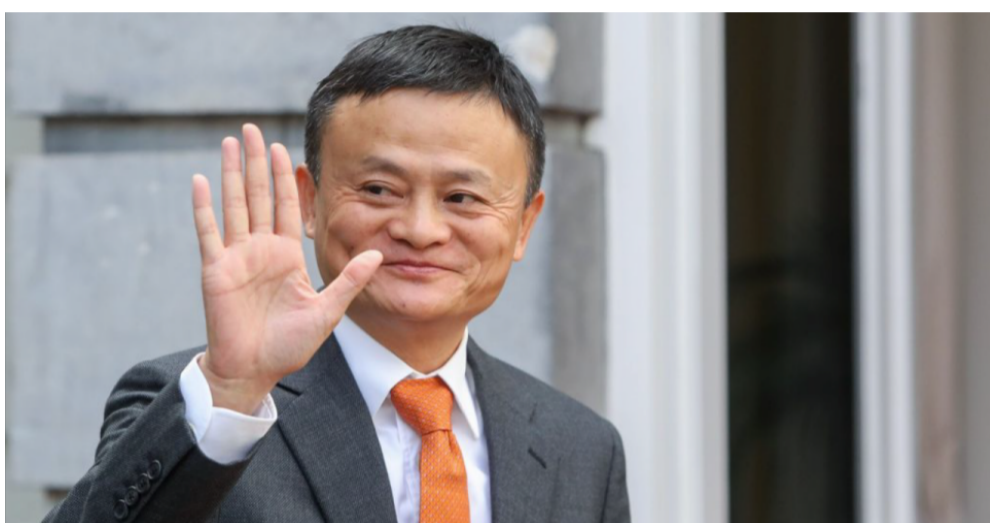
Миллиардер Джек Ма жоғалып кетті