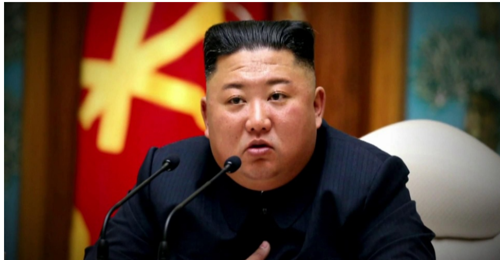
АҚШ елдің «басты жауы»